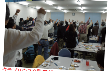
クラブハウス2階でパーティー!