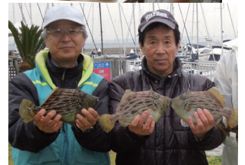
目指すは、一尺カワハギ(30.3cm)!